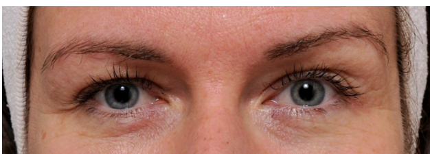
Halva ansiktet gjort. Ögat till höger har fått ett lyft, är öppnare och huden runtomkring är stramare.

Huden masseras och slipas med koksaltlösning som blåses ut i jetstrålar.